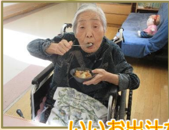
いいお出汁がでてるよ！